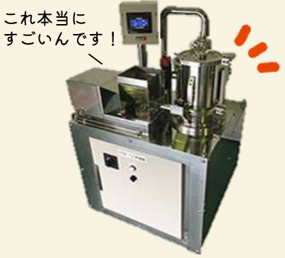
これ本当に すごいです！