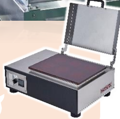
卓上パンケーキクッカー